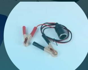
OBD II 16