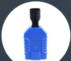
Shang Chai 4