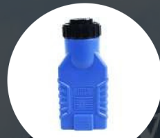
Dong Feng 16