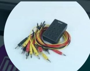
Caja de Pines