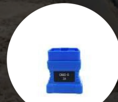
OBD II 16